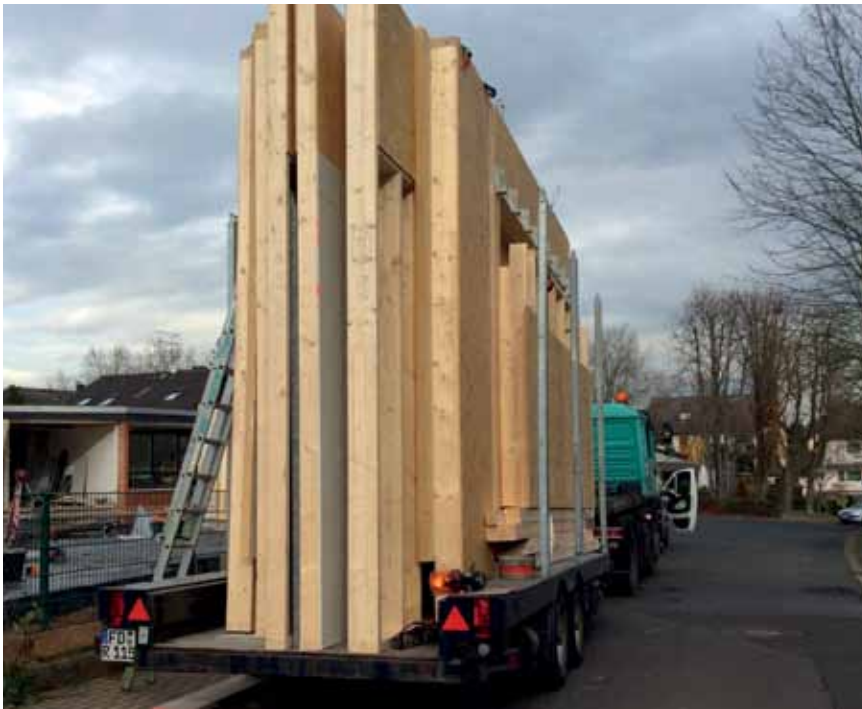
Noch passen zwei Gruppenräume auf einen LKW

Zunächst zeugte nur das gerodete Außen- gelände am Kinderhaus Panama davon, dass hier demnächst etwas passieren wür- de. Im September wurde der Bauzaun er- richtet und danach gab es jeden Tag etwas Neues zu beobachten. Die Logenplätze an den Fenstern des Kindergartens waren be- reits frühmorgens belegt, wenn der Bagger anrückte um das Erdreich auszuheben. Mittlerweile ist viel geschafft: Bodenplatte, Holzständerbau und Dach sind errichtet. Vor Weihnachten, so die Architekten, soll der Anbau trocken und dicht sein.