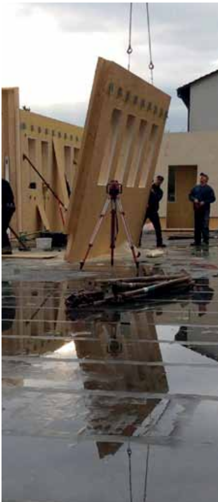
...und zack – wieder eine Wand gestellt!