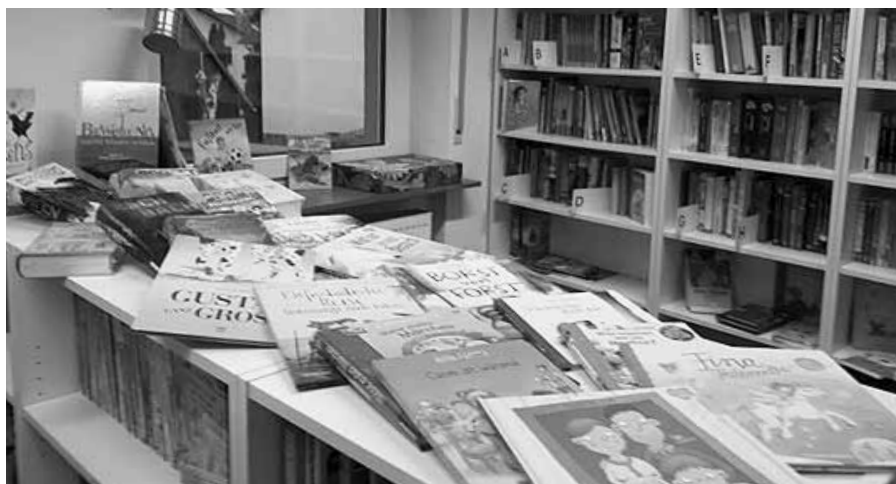
Zahlreiche neue Bücher warten auf die kleinen Besucher

Das Team der Gemeindebücherei wünscht allen kleinen und großen Lesern eine besinnliche Weihnachtszeit und einen guten Start ins neue Jahr!