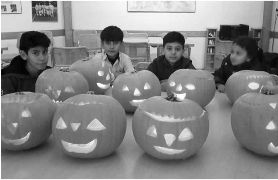
...wurden im Vereinsheim des TC Neuberg Kürbisgesichter geschnitzt.

Während dieser Zeit, die teilweise über zwei Jahre dauert, sind die Geflüchteten in ihren Integrationsbemühungen stark eingeschränkt. In dieser Zeit haben sie keinen Anspruch auf Integrationskurse und unterstehen der Residenzpflicht. Dieses stellt eine zusätzliche Belastung