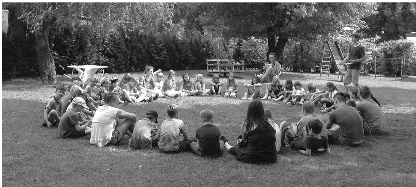
Bürgerversammlung in Kinderhausen

Der Neuberger Kindersommer 2018 findet wie immer in den letzten beiden Wochen der hessischen Sommerferien statt (23. Juli bis 3. August 2018). Das Programmheft wird ab dem 23. Mai 2018 an alle teilnahmeberechtigten Kinder verteilt: Über die Kitas, in den Klassen der Erich-Simdorn-Schule und per Post. Teilnahmeberechtigt sind alle Kinder in Neuberg zwischen 6 und 13 Jahren. Der Kartenverkauf findet statt am Mittwoch,