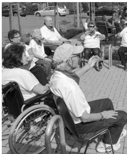
Die Sitztanzgruppe in Aktion