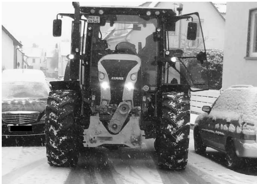
Kein Durchkommen für den Neuburger Winterdienst

Der Schnee muss so geräumt werden, dass auf dem Bürgersteig zwei Personen aneinander vorbeigehen können. Die Räum- und Streupflicht beginnt morgens um 7:00 Uhr und endet abends um 20:00 Uhr. Bei Dauerschneefall oder Eisregen kann man warten bis es aufgehört hat. In allen anderen Fällen müssen die Anlieger dafür sorgen, dass die Wege ohne Gefahr passierbar sind, dass heißt, wenn nötig ist, auch mehrmals am Tag Schnee zu räumen bzw. zu streuen. Bei Straßen, an denen kein Bürgersteig vorhanden ist, ist mindestens auf einer Seite ein Streifen auf der Fahrbahn zu räumen. Hieran müssen sich die Anlieger von beiden Straßenseiten beteiligen. Bei Durchgängen zwischen Grundstücken sind die Anlieger ebenfalls zur Räumung verpflichtet. Wer diesen Pflichten nicht