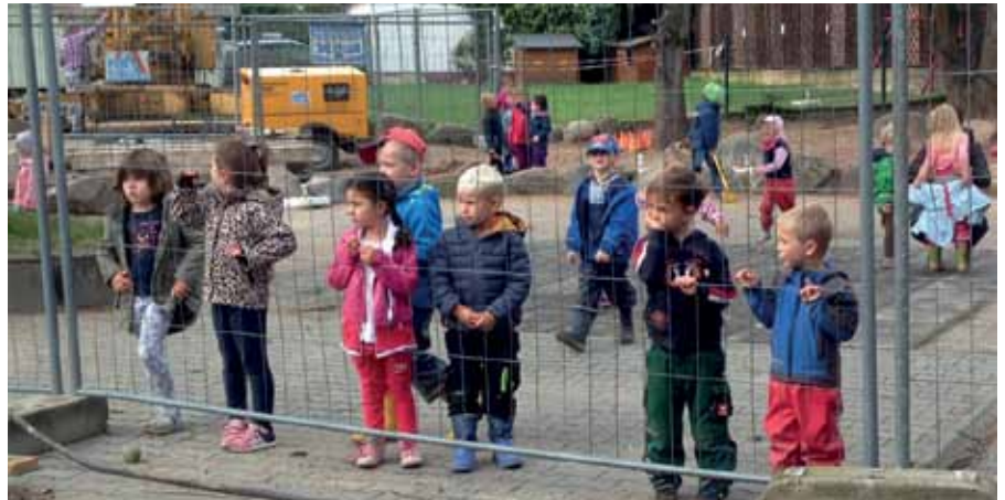
Logenplätze für zukünftige Architektinnen und Ingenieure