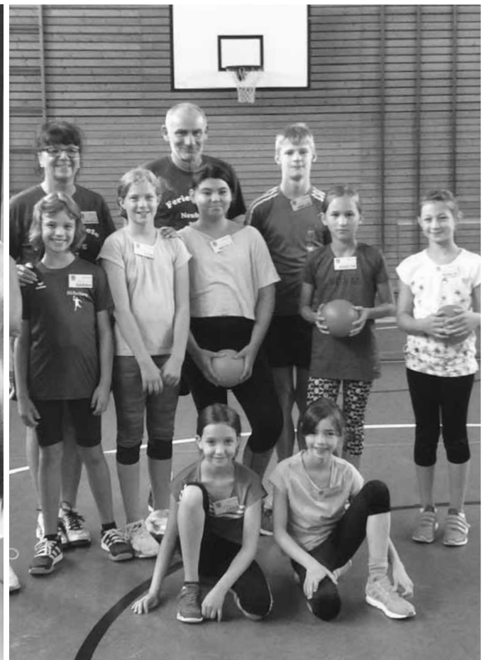
Die künftigen Handballprofis