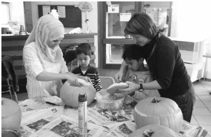
Unter fachkundiger Anleitung...

Seit nun fast drei Jahren unterstützt der „Willkommenskreis Asyl“ die in Neuberg lebenden Geflüchteten hierbei. Es ist oft ein steiniger Weg für alle Beteiligten. Viele Geflüchtete sehen sich in ihren Erwartungen enttäuscht und für die ehrenamtlichen Helfer ist es keine leichte Aufgabe, die hier herrschenden Gegebenheiten, Gepflogenheiten und Regeln zu vermitteln. Sehr anspruchsvoll ist auch die Unterstützung der Geflüchteten mit unklarer Bleibeperspektive. Diese Menschen leben in einem ständigen Zu-