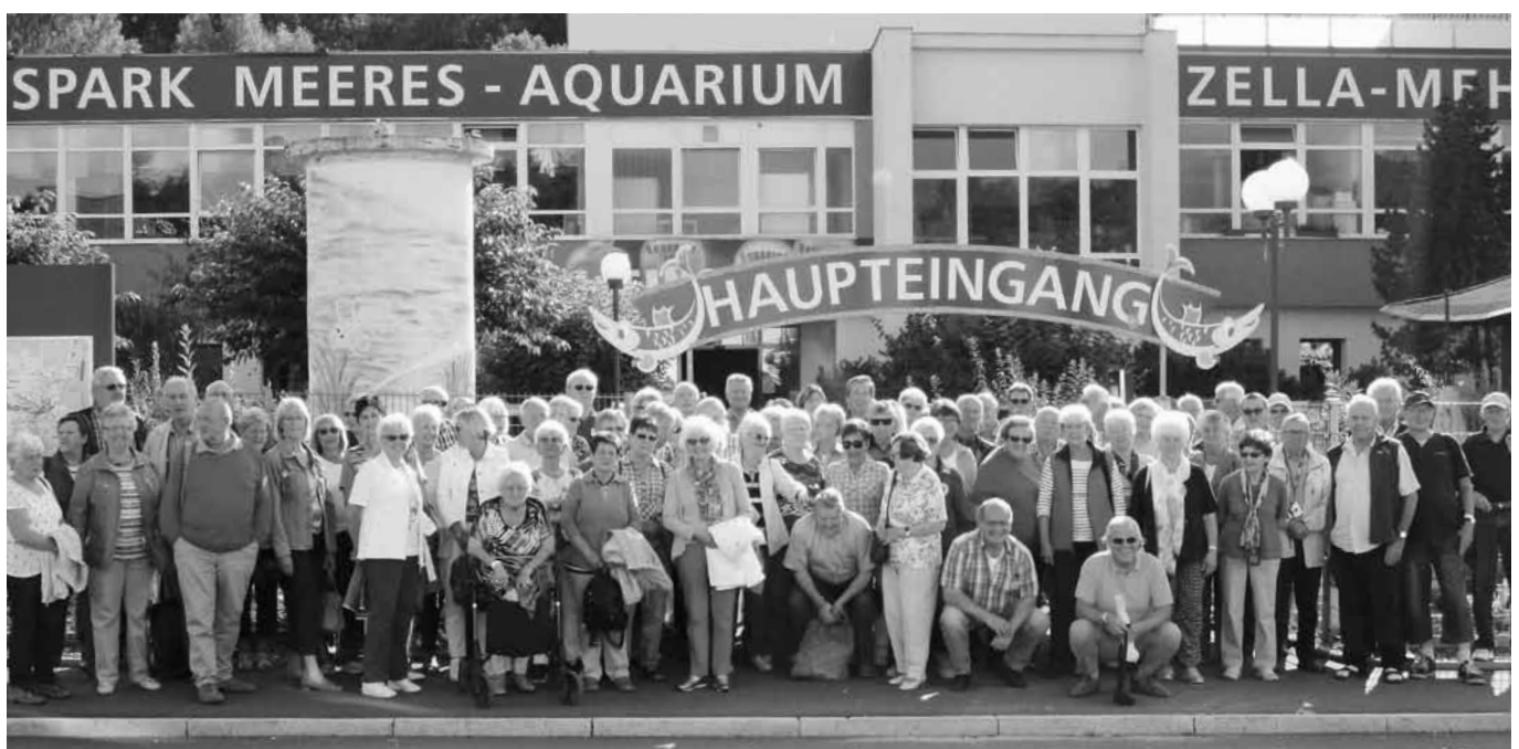
Die Teilnehmer des Seniorenausflugs vor dem Meeresaquarium in Zella-Mehlis