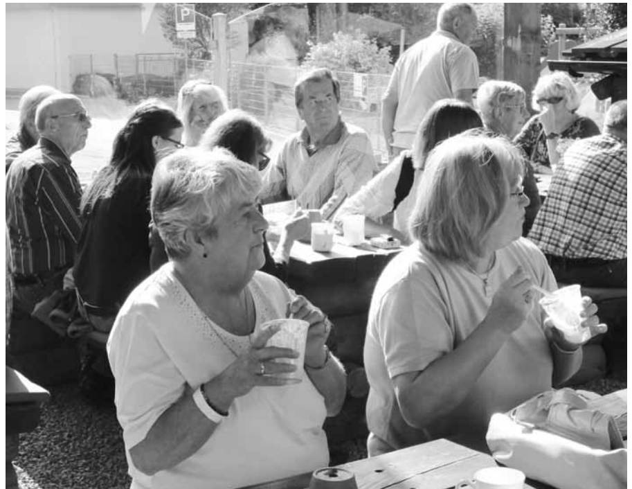
Wohlverdiente Pause bei Kaffee, Kuchen und Eis

Nach zweieinhalb Stunden Fahrt, die uns bei herrlichem Sonnenschein durch das Dreiländereck Hessen-Bayern-Thüringen führte, kamen wir in Zella-Mehlis an. Im urig eingerichteten Wirtshaus „Toschis Station“ wurde das Mittagessen eingenommen. Im Anschluss erfolgte die kurze Weiterfahrt zum größten Meeres-Aquarium im mitteldeutschen Raum. Die Teilnehmer waren fasziniert von der bunten Farbenpracht der Unterwasserwelt der tropischen Ozeane. Die insgesamt über 2.000 Fische der 200 verschiedenen Arten sowie die farbigen und teils seltenen Korallen sind einfach sehenswert. Ein Besuchermagnet waren natürlich auch die verschiedenen Haiarten und das Krokodilgehege, welches über das gesamte Obergeschoss führte. Nach mehreren Rundgängen, auf denen man immer wieder neue Eindrücke sammeln und Sehenswertes entdecken